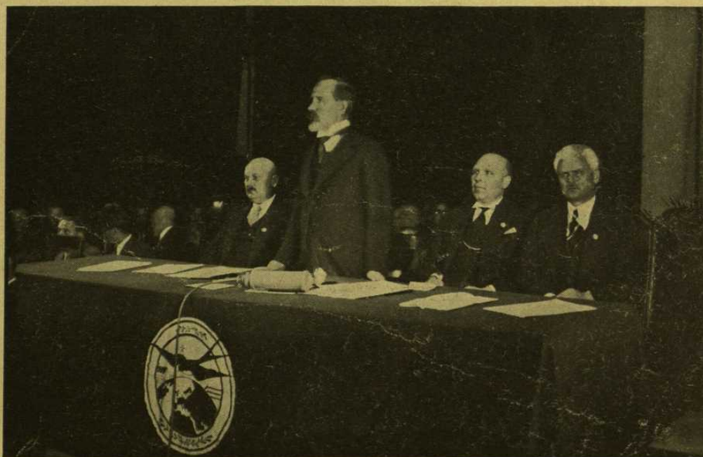
J. E. Respublikos Prezidentas sveikina Pasaulio Lietuvių Kongresą.

Dar ir šiomis sąlygomis Sąjungos Valdyba negalės plačiai išplėsti savo darbo, bet pirmasis žingsnis daromas „Pasaulio Lietuvio“ leidimu.