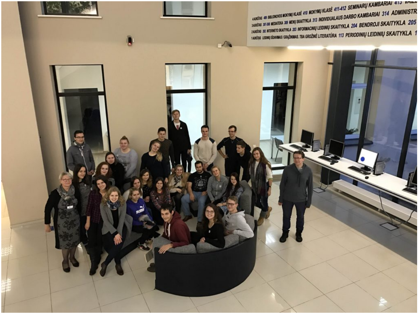
Šiaulių universiteto bibliotekos fojė