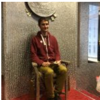
Timūras (Rusija) Centų kambaryje

pasirūpinta specialia teksto didinimo įranga ir kitomis taip reikalingomis technologijomis.