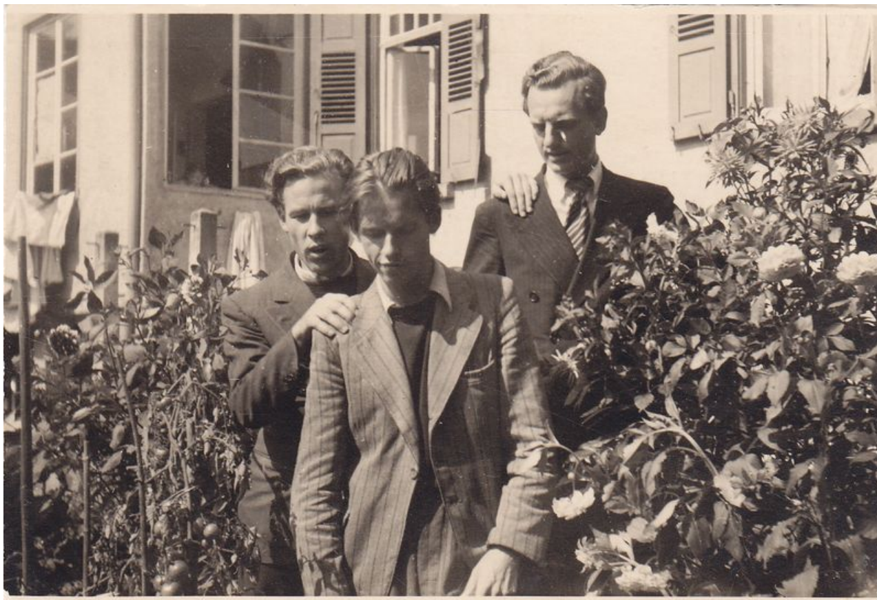
H. Nagys, Alf. Nyka - Niliūnas, J. Kaupas, Tiubingenas. 1945.

Bet svarbiausia, kad 1948 m. išleido savo pasakų rinkinį „Daktaras Kripštukas pragare“. Monografijos apie J. Kaupą autorė Laimutė Tidikytė nusako bendrąjį to meto lietuvių jaunųjų rašytojų literatūrinio gyvenimo kontekstą: „Jaunieji rašytojai ne tik skaitė Vakarų moderniąją literatūrą, studijavo universitetuose, daug keliavo, bet jaunatviško maksimalizmo skatinami nebijojo eksperimentuoti.“ [iii] Šiuo laikotarpiu yra išleista ne tik Kaupo pirmoji knyga, netradicinių, modernių pasakų knygomis penktajame dešimtmetyje debiutavo broliai Adolfas ir Jonas Mekai, novelių knygomis – Marius Katiliškis, Antanas Škėma.