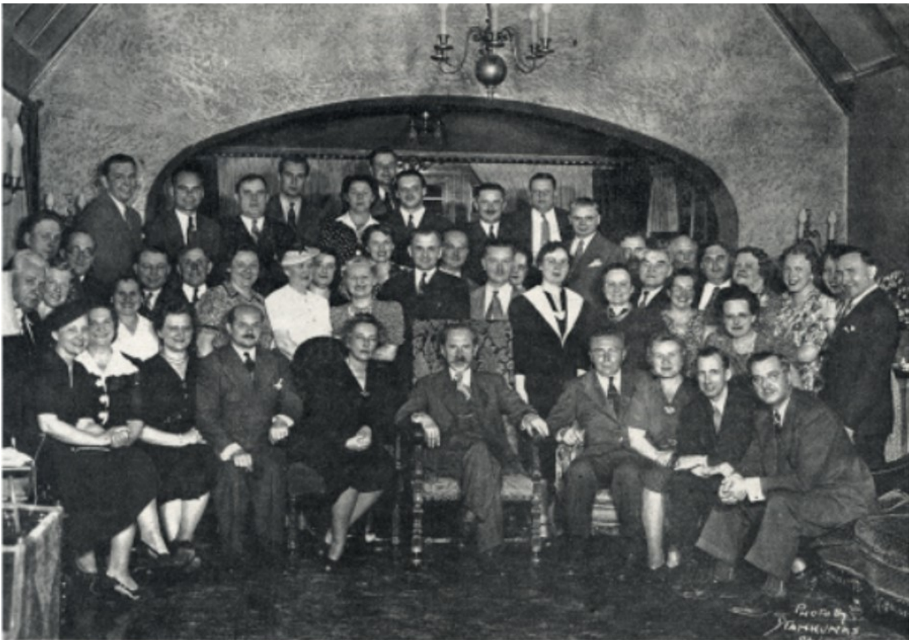
Prezidentas Antanas Smetona su žmona Sofija Smetoniene dalyvauja susitikime su Čikagos lietuviais, 1941 m.