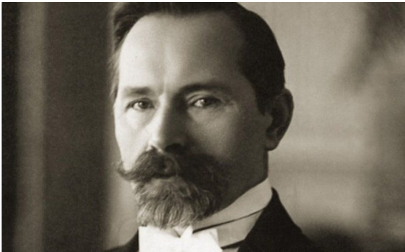
Antanas Smetona.

pradėjo veikti Lietuvos laisvinimo kelyje, bandydamos telkti lietuvių išėiviją. A. Smetonos dalyvavimas LNŠF veikloje – tai vienas jo veiklos JAV lietuvių išėivijoje epizodų.