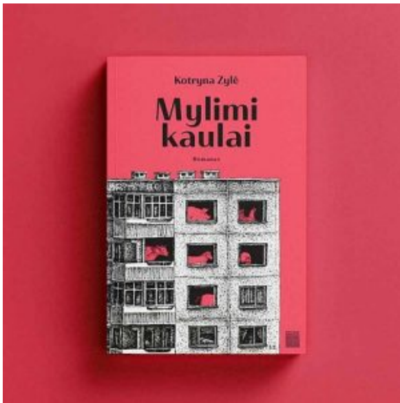
„Mylimi kaulai“ | Knygos viršelis

Premijai buvo pasiūlyta dvylika kandidatų.