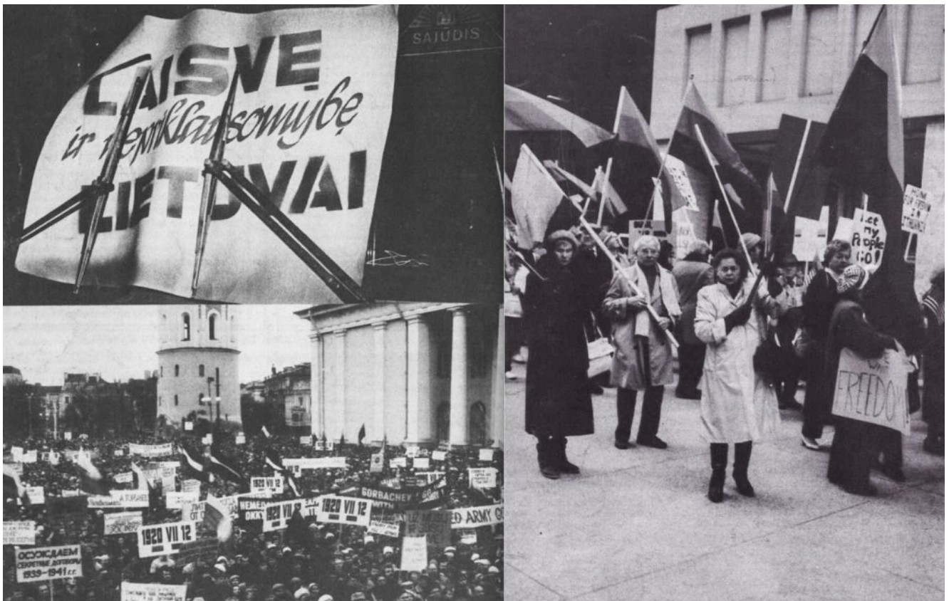
Protestai Lietuvoje ir JAV.