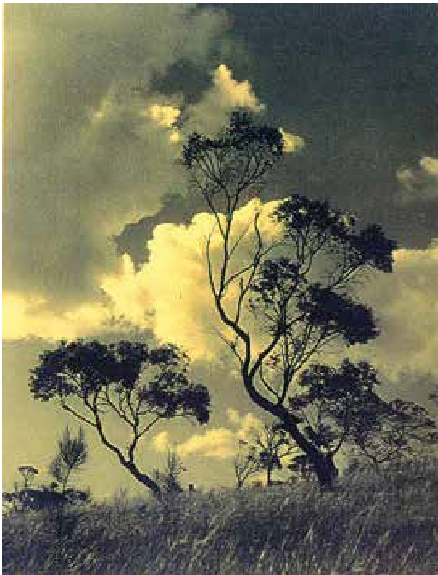
Tasmanija.