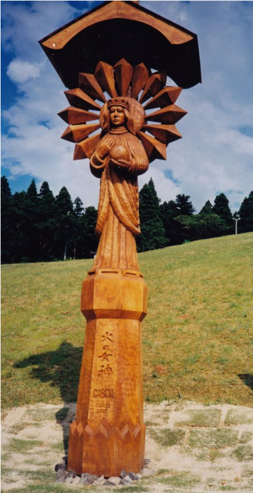
„Gabija”, ugnies deivė, Inami, Japonija

Visuotinėje lietuvių enciklopedijoje [1] rašoma, jog Japonijos santykiai su Lietuva siekia dar XVII a., kai jėzuitų misijose Japonijoje buvo vienuolių iš Lietuvos. XX a.