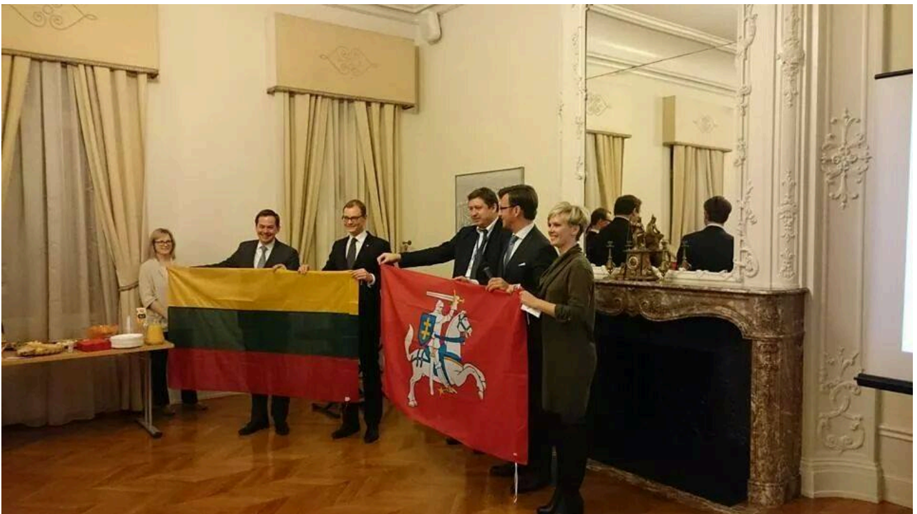
Lietuvių kultūros centro Belgijoje atidarymo šventės akimirkos

LKCB vykdo trijų krypčių veiklą: šeštadieninė lituanistinė mokyklėlė, lietuvių kalbos kursai užsieniečiams ir kultūrinė, edukacinė veikla suaugusiems ir