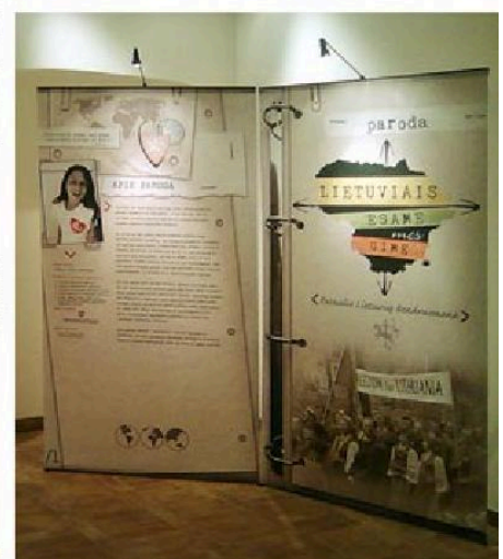
Parodoje „Lietuviais esame mes gimę“.

Parodoje pasakojama apie skirtinguose pasaulio kraštuose atsidūrusių lietuvių pastangas siekti Lietuvos nepriklausomybės. Štai 1960 metų birželio 18 dieną