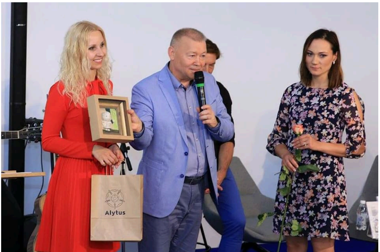
ir Alytaus miesto meras Vytautas Grigaravičius