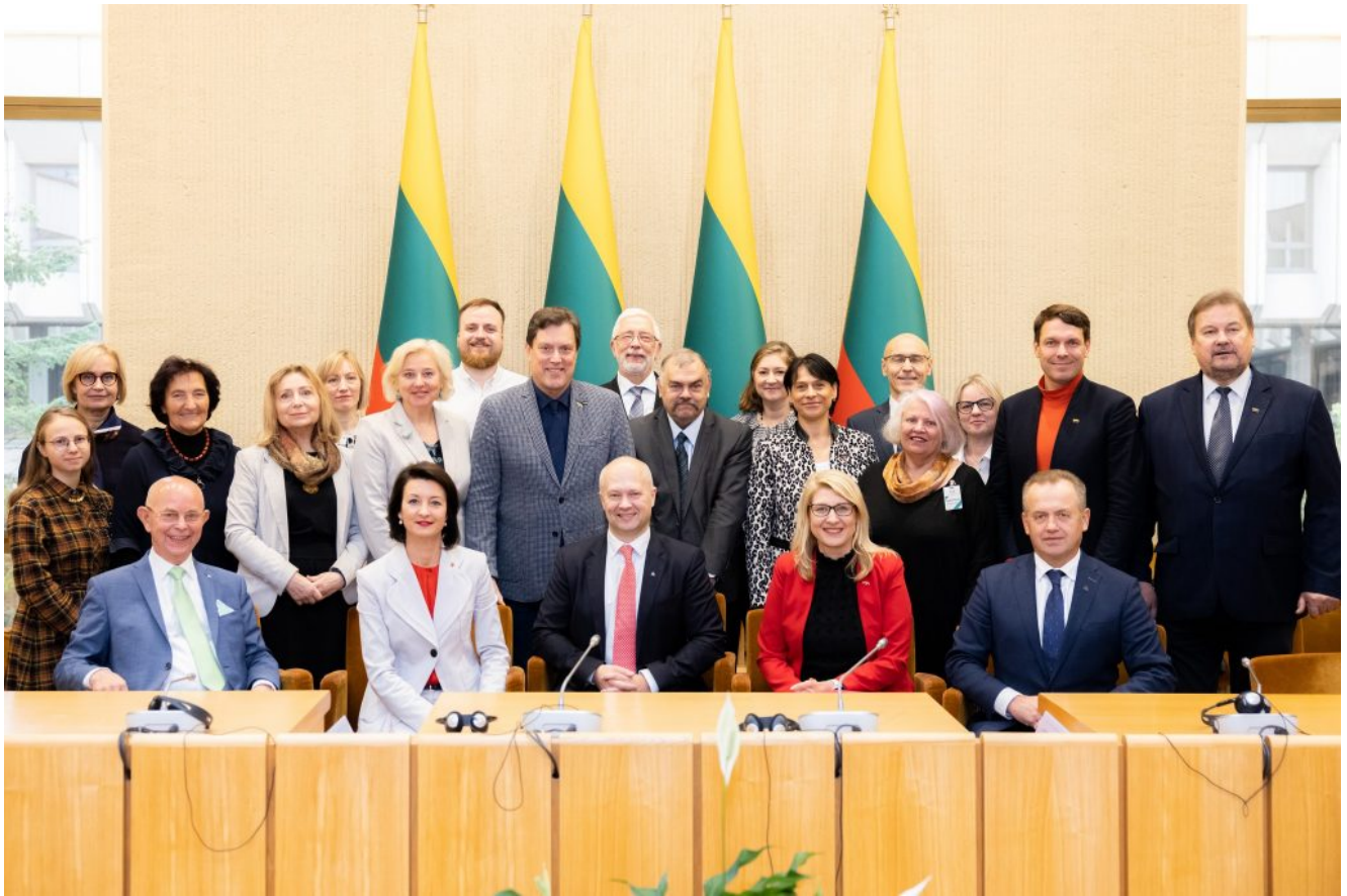
LR Seimo ir Pasaulio Lietuvių Bendruomenės komisijos pasitarimas. (2022 m. rudens sesija)