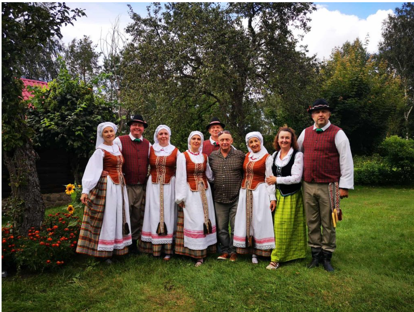
Šokių kolektyvas „Aukštaičiai“

Po mišių visus pakvies įtraukianti vakaronė, kurioje skambės autentiškos lietuvių liaudies dainos, suksis tradiciniai rateliai ir klegės bendrystės džiaugsmas.