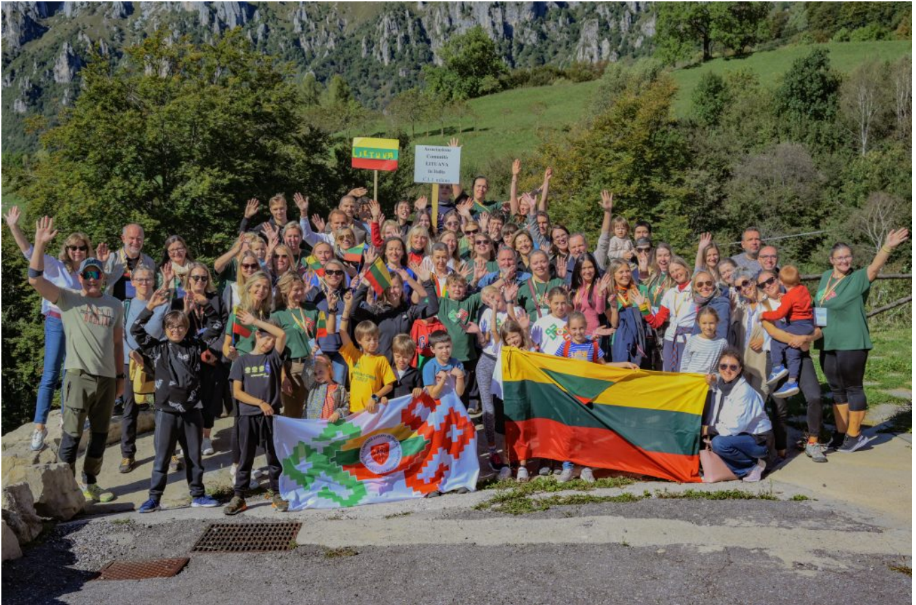
2024 m. suvažiavimo akimirkos

Suvažiavime bus gausu vaikams skirtų edukacijų: nuo muzikinio interaktyvaus spektaklio apie M. K. Čiurlionio gyvenimą, susitikimų su rašytojais iki tautinių juostų rišimo su liaudies šokių kolektyvų nariais.