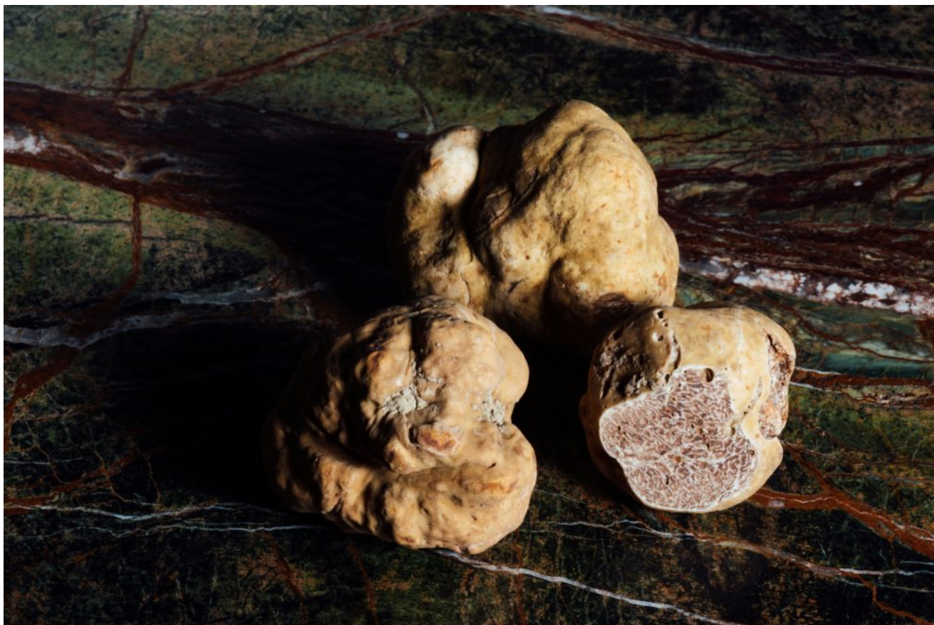
Baltieji trumai

trumpoje ekskursijoje po laukus. Pasakojimą apie risotto istoriją vainikuos degustacija vietos ūkyje.