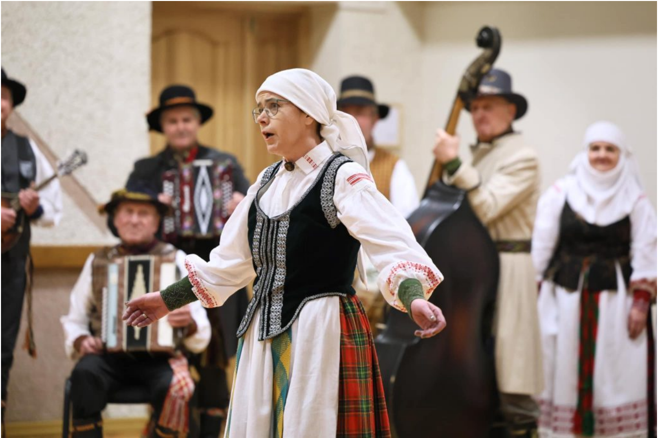
„Upytės Vešeta“

Abu kolektyvai aktyviai koncertuoja Lietuvoje ir už jos ribų, dalyvavo tarptautiniuose festivaliuose Egipte, Lenkijoje ir Latvijoje, 2024 m. pasirodė Lietuvių dainų šventės folkloro dienoje, o „Upytės Vešeta“ Lietuvos nacionalinio kultūros centro įvertinta II kategorija už aukštą meninį lygį. Kolektyvai - ir Lietuvos kadrilinių šokių varžytuvių pirmosios vietos laimėtojai.