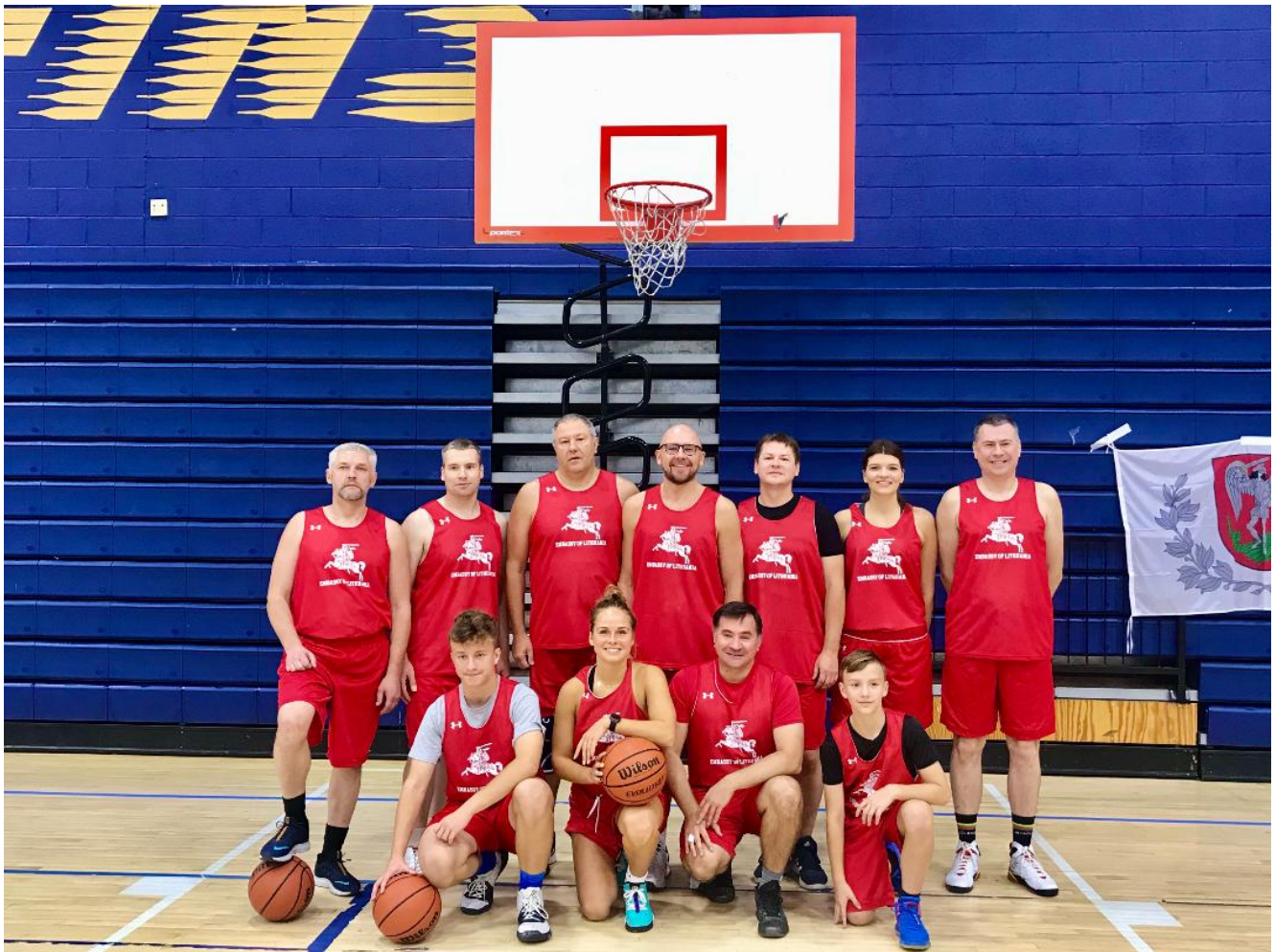
LR ambasados komanda, 2019 m.

Jutos, Kalifornijos ir Naujojo Džersio valstijų. Šiemet turnyre pirmą kartą rungtyniavo ir krepšinio komanda iš Lietuvos, Sostinės krepšinio mėgėjų lygos.