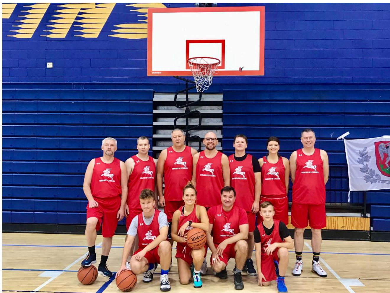
LR ambasados komanda, 2019 m.

Jutos, Kalifornijos ir Naujojo Džersio valstijų. Šiomet turnyre pirmą kartą rungtyniavo ir krepšinio komanda iš Lietuvos, Sostinės krepšinio mėgėjų lygos.