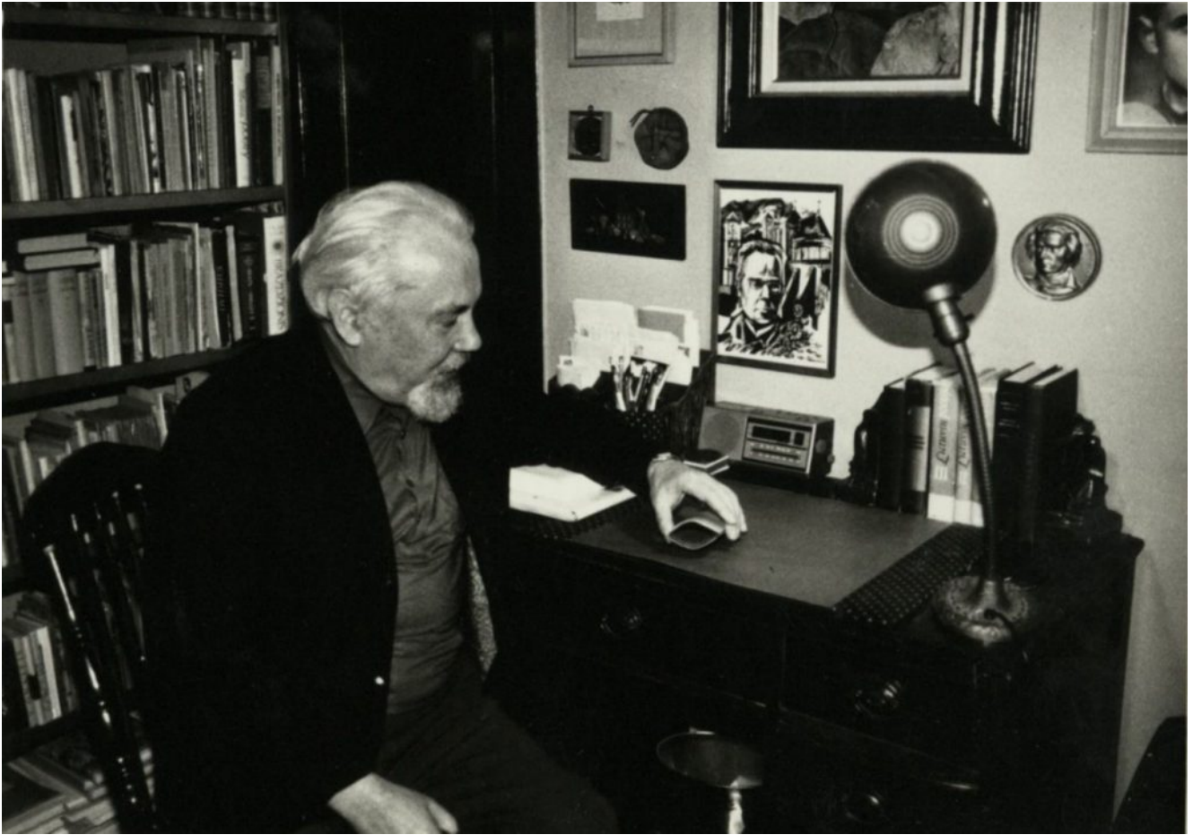
Savo namuose Čikagoje 1989 m.