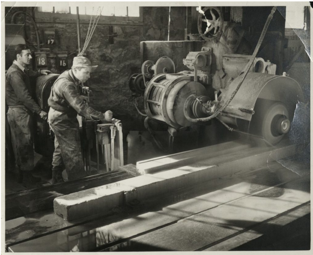
Akmenų šlifavimo fabrike. 1955 m.