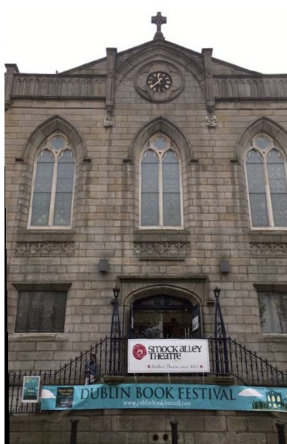
Dublino vazdai

Senoji seminarija dabar sudaro pietinę universitetinio miestelio dalį, kur yra teologijos fakultetas, iki šiol ruošiantis kunigus. Nuo šiaurinės miestelio dalies ją skiria moderni ir jauki Jono Pauliaus II vardo biblioteka. Meinutas turi ir miesto biblioteką (beje, joje yra ir pagarsėjusios Lietuvoje amerikiečių rašytojos Rūtos Šepetys knyga „Between the Shades of Gray“, liet. „Tarp pilkų debesų“).