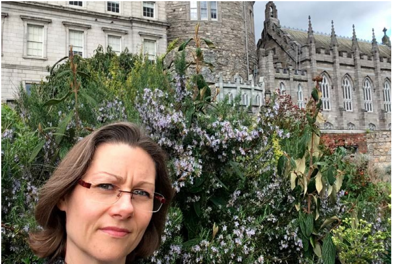
Meinuto universiteto miestelyje.