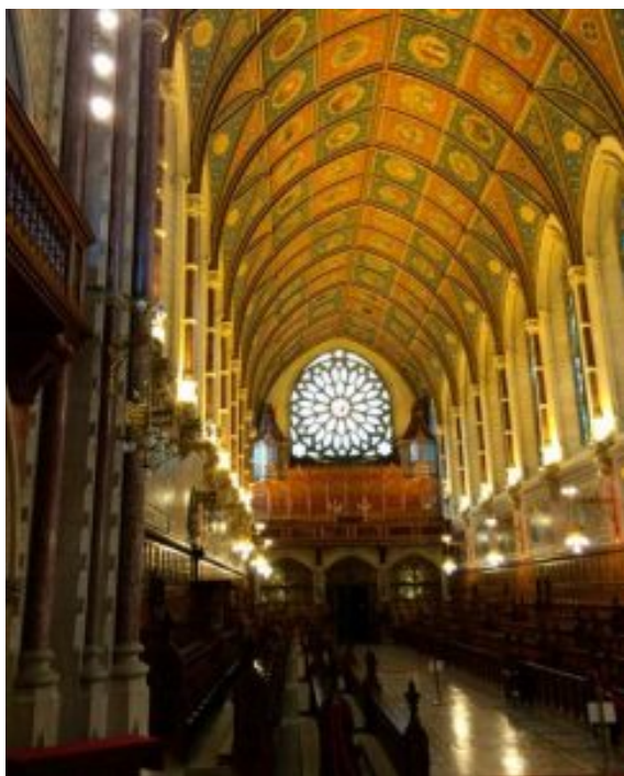
Meinuto universiteto miestelio koplyčia

Žinią apie mano kraustymąsi iš Ženevos į Dubliną pažįstami, draugai ir net šeimos nariai sutiko kiek susirūpinę ir net pabūgę. Keli šveicarai ne juokais pyktelėjo, tarsi šiuo „įžūliu“ sprendimu būčiau „nuvertinusi“ jų šalį. Daug kas „baugino“ mane šaltu oru, lietumi, nepritekliais ir lietuviškų „budulių“ kaimynyste. Tenka pripažinti, jog visa tai Dubline išties patyriau, tačiau vis tiek mano gyvenimas tapo prasmingesnis ir mielesnis.