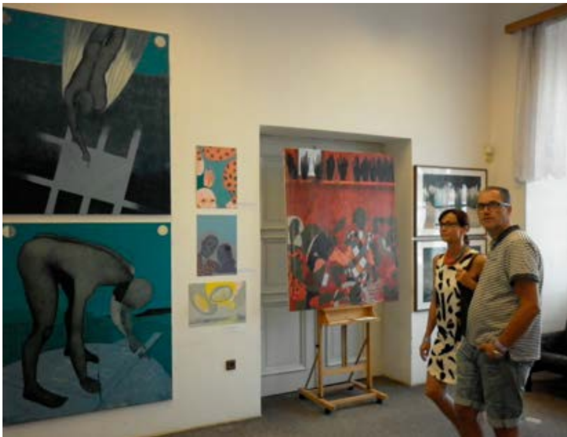
Iš parodos Čekijoje. Jicin, 2015

Bet gal visose valstybėse šitaip – kai atvyksti iš svetur, tai ir esi „ne savas“, atvykėlis? Kaip manai?