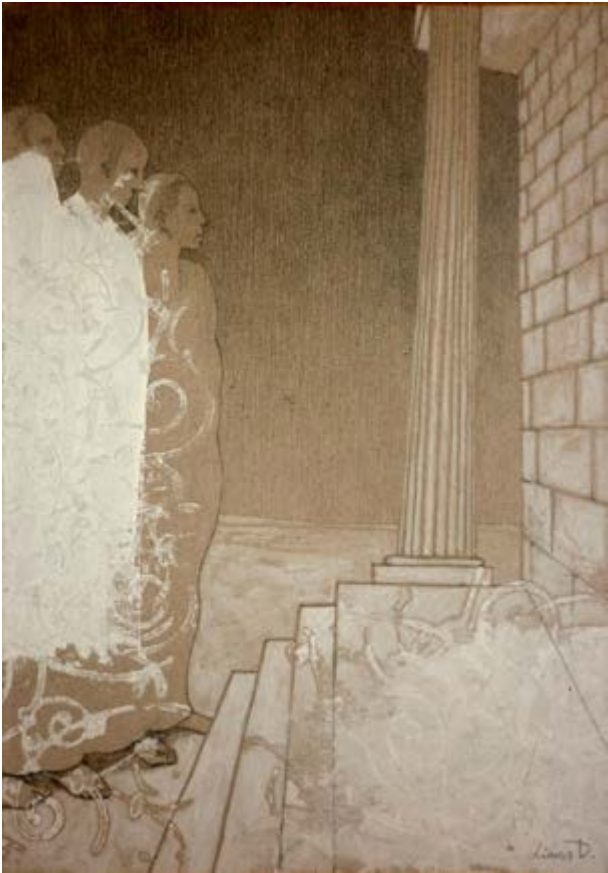
Ciklo fragmentas. Ciklas dar neužbaigtas. Šiuo metu yra padaryta apie 40-50 piešinių.