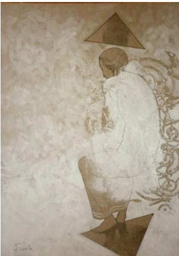
Grafitas, tempera, kartonas