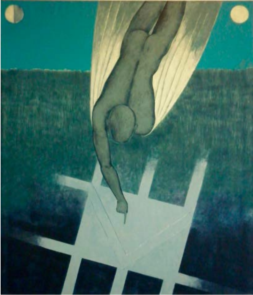
Linas Domarackas. Diptikas „Geometrija I“. Akrilas