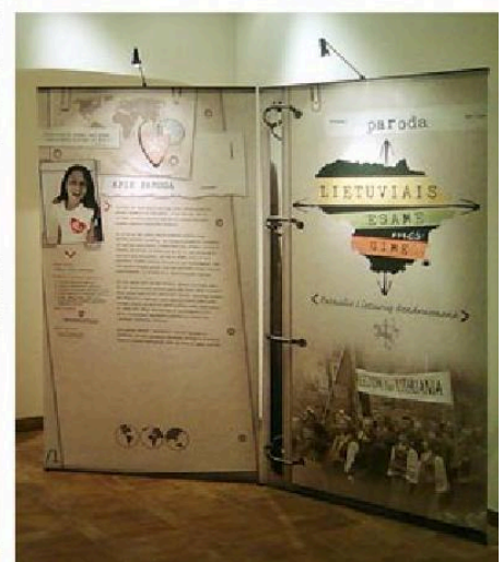
Parodoje „Lietuviais esame mes gimę“.

Parodoje pasakojama apie skirtinguose pasaulio kraštuose atsidūrusių lietuvių pastangas siekti Lietuvos nepriklausomybės. Štai 1960 metų birželio 18 dieną